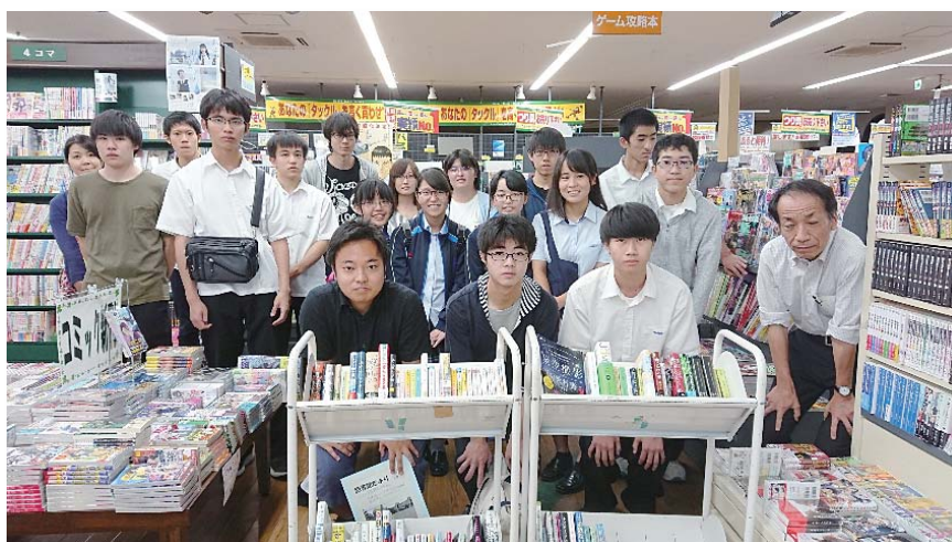
田中書店川東店にて