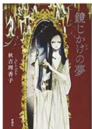
『鏡じかけの夢』 秋吉 理香子著 (KADOKAWA)