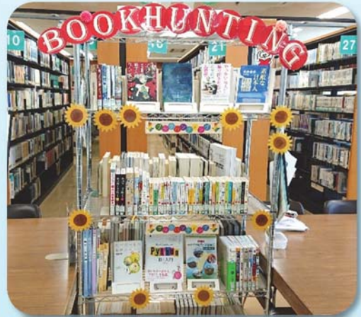
第一閲覧室に展示中