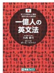
『一億人の英文法』 大西 泰斗著 (ナガセ)