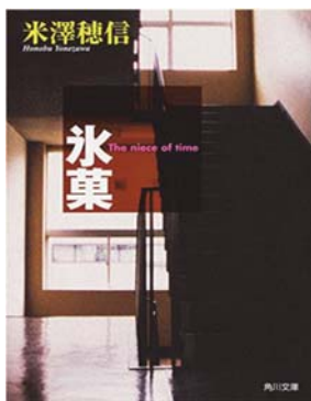
『氷菓』 米澤 穂信著(角川書店)

学生図書委員会では、毎年、図書館のテーマ展示を企画し第一閲覧室に展示しています。 平成30年度第1回テーマは「図書委員のおすすめ本」です。