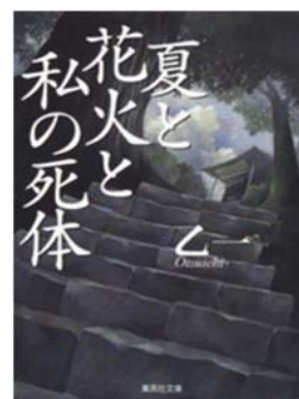
『夏と花火と私の死体』 乙一著(集英社)