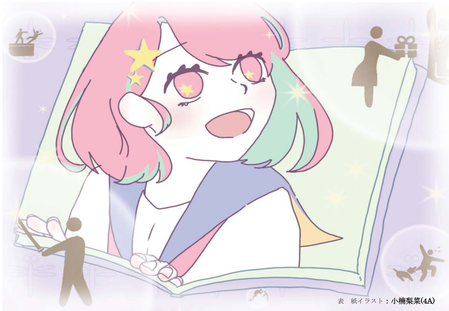
表紙イラスト：小楠梨菜(4A)