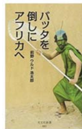
『バツタを倒しにアフリカへ』 前野 ウルド浩太郎著 (光文社)