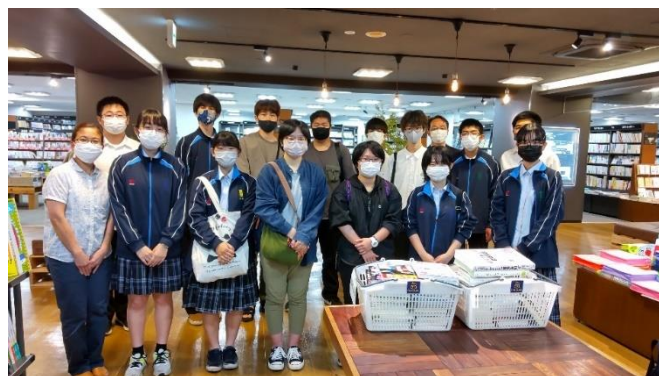
参加した図書委員全員で記念撮影。

文庫本から学術書まで幅広いジャンルの書籍があるので、ぜひ図書館に立ち寄ってみてください。